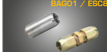
BAG01 / ESC8